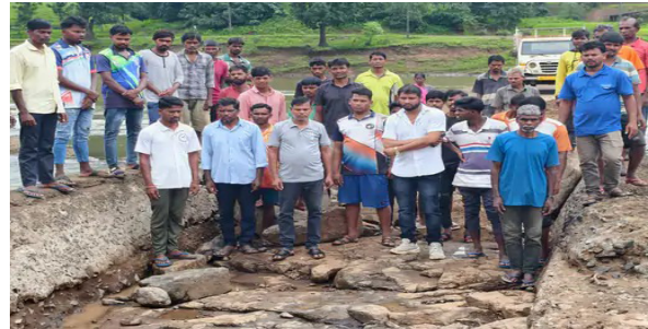
डेयर टू शेरर - धरमपुर