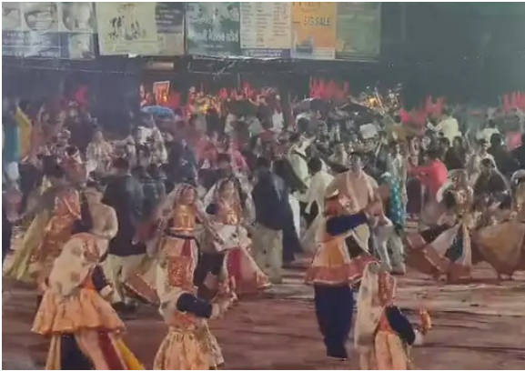
दर्शक बारिश से बचने के लिए सिर पर कुर्सियाँ रखकर छिपने की कोशिश करते दिखे। यह

वलसाड के अन्नगामा में आयोजित गोकुल ग्रुप नवरात्रि महोत्सव में खिलाड़ी बारिश के बीच भी गरबा खेलते रहे। भारी बारिश के बावजूद खिलाड़ियों का उत्साह बरकरार रहा। खिलाड़ी गरबा की लय और कदमों में इतने मान थे कि उन्हें बारिश का एहसास ही नहीं हुआ। वे पूरी तरह से गरबा की धुन में डूबे नजर आए। वहीं दूसरी ओर, महोत्सव में मौजूद