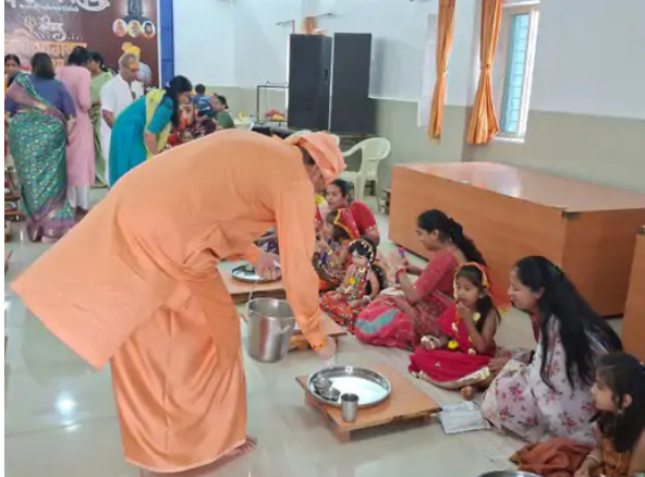
डेयर टू शेरर - वलसाड के भीड़भंजन महादेव मंदिर में नव बंदोगी पूजा का कार्यक्रम नवरात्रि के नौवें दिन वलसाड

अवसर पर गौरी पूजा और गौरी भजन का भी आयोजन किया गया। इस पूजा में नौ से अधिक कन्याओं की पूजा की गई। इन कन्याओं की पूजा नव दुर्गा के रूप में की गई। भीड़भंजन महादेव मंदिर के व्यवस्थापक शिवजी महाराज और अन्य प्रमुखों ने कन्याओं की पादुका पूजा सहित विभिन्न अनुष्ठान संपन्न कराए। इस पूजा के माध्यम से वलसाड समेत पूरे जिले के लोगों के स्वास्थ्य और उनकी सभी मनोकामनाओं की पूर्ति के लिए प्रार्थना की गई।